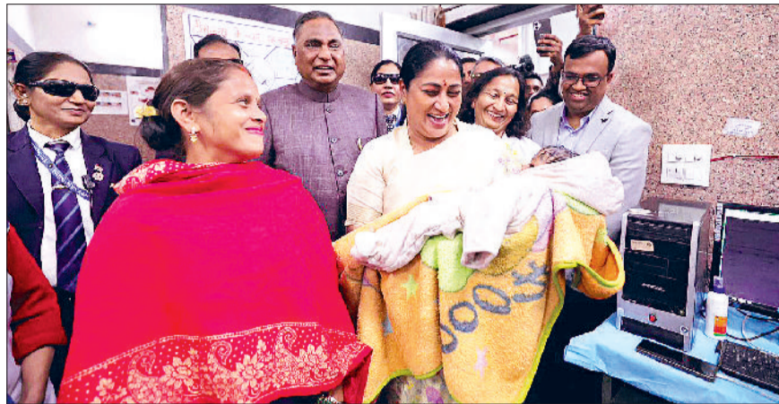
मुख्यमंत्री ने छतरपुर विधानसभा में भी 322 करोड़ रुपये की विकास योजनाओं की शुरुआत की। इस अवसर पर दक्षिण दिल्ली के सांसद

दिल्ली सरकार ने शुक्रवार को दिल्लीवासियों को 51 नए आयुष्मान आरोग्य मंदिरों को समर्पित किया। इन आरोग्य मंदिरों का लोकार्पण शुक्रवार को फतेहपुर बेरी गांव से मुख्यमंत्री रेखा गुप्ता ने किया। इन नए केंद्रों की शुरुआत से दिल्ली में आयुष्मान आरोग्य मंदिरों की कुल संख्या बढ़कर 370 हो गई है, जो मात्र आठ महीनों में हासिल की गई बड़ी उपलब्धि है। मुख्यमंत्री ने कहा कि दिल्ली सरकार की प्राथमिकता है कि प्रत्येक नागरिक को समय पर सुलभ और किफायती उपचार उपलब्ध हो। इसके अलावा,