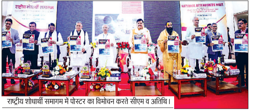
राष्ट्रीय शोधार्थी समागम में पोस्टर का विमोचन करते सीएम व अतिथि।