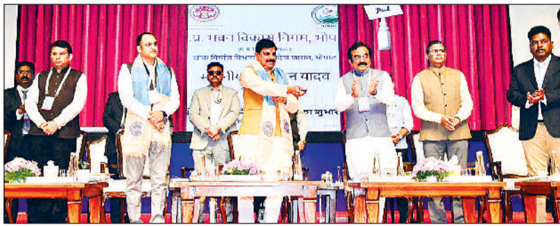
मुख्यमंत्री डॉ. यादव ने कहा कि इंजीनियर्स को अपना काम करने में अनेक चुनौतियों का भी सामना करना पड़ता है। आज की कार्यशाला में एमपीआईसीसी सहित देश की विभिन्न संस्थाओं के साथ सम्मिलित हुए हैं। प्रदेश में वीन बिल्डिंग के विकास को लेकर सहमति बनी है। डॉ. यादव ने सभी कर्मों और नवाचारों के लिए लोक निर्माण मंत्री एवं विभाग को बधाई दी। उन्होंने कहा कि वैचारिक प्रतिबद्धता और कार्यशैली में जड़ता से बचने और बदलती तकनीकों के अनुरूप स्वयं को अद्यतन रखने के लिए कौशल संवर्धन अत्यंत आवश्यक है। इसी कार्यशाला पर अभियंताओं की क्लिफ्ट को रिफ्रेश करती है और उन्हें नई ऊर्जा प्रदान करती है। उन्होंने निर्माण कार्य में दीर्घकालिक दृष्टि, नवाचार और पारदर्शिता को प्राथमिकता देने पर जोर दिया।