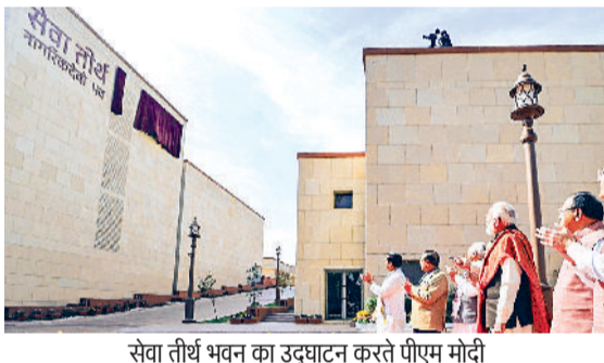
सेवा तीर्थ भवन का उद्घाटन करते पीएम मोदी

पीएम ने कहा- नया मवन ब्रिटिश सोच से नुवत, जनता की आकांक्षाएं पूरी करेंगे